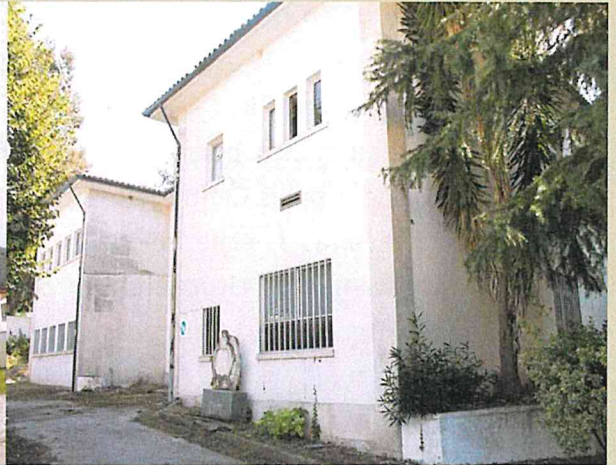
Hospital S. João

A taxa de inflação com brutal subida de custos exige o combate ao desperdício e melhorar a eficiência, sem perda da qualidade e da bondade na prestação de cuidados.