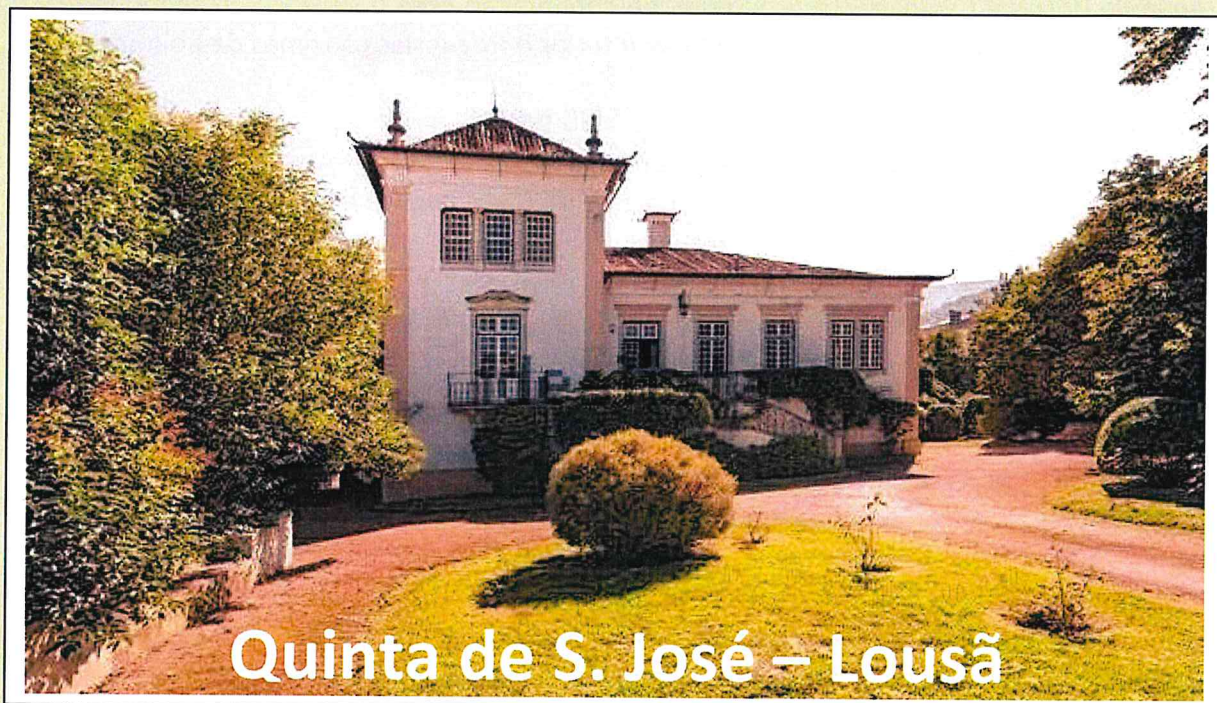
Quinta de S. José – Lousã